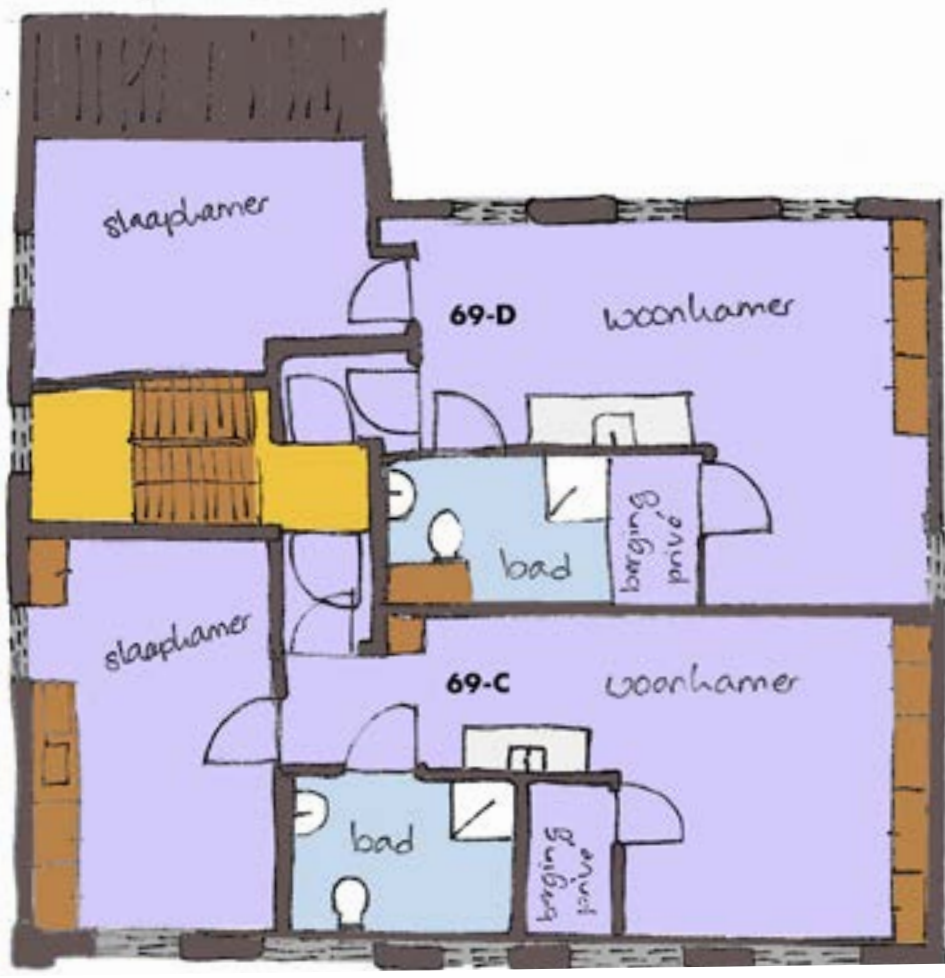
Tweede verdieping oudbouw